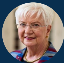
Gerda Hasselfeldt Präsidentin des Deutschen Roten Kreuzes

Viele ältere Menschen wollen möglichst lange in der eigenen Wohnung leben. Der Hausnotruf ist dafür essenziell und ein wichtiger Teil der Versorgung. Zudem gibt er sorgenden Angehörigen Sicherheit und ein gutes Gefühl – denn für den Notfall ist Hilfe nur einen Knopfdruck entfernt.